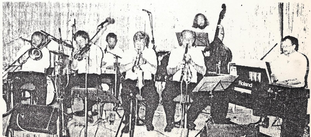
Hot House Jazzmen från Malmö, som spelade kraftfull tradjazz i bästa San Francisco-stil typ Lu Watters.