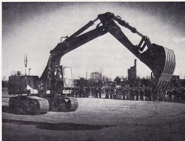
Här är en av de stora Caterpillarna.