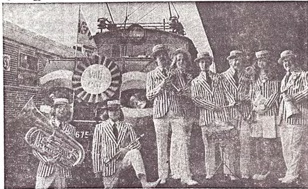
Med på turné i olika delar av Sverige och i Skövde var också dixielandbandet Scaniazz, Malmö.